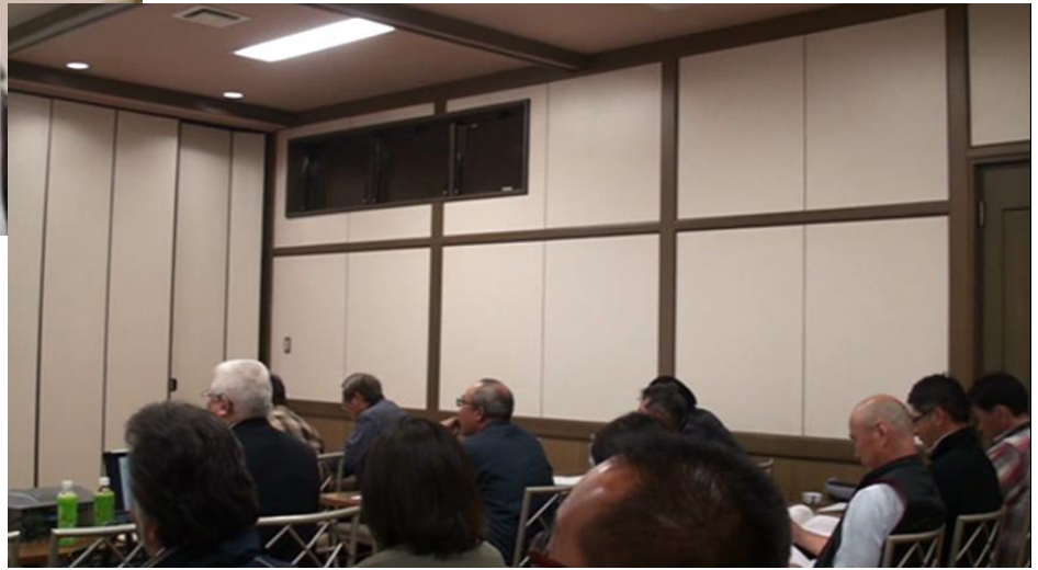
【第五回 アビオスファーム会 参加者メンバーと会場の様子】